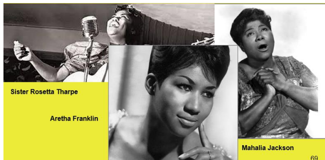
Sister Rosetta Tharpe